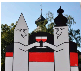
Bild: Chilebeiz-Tafel vom dörflich-ökumenischen Fest 2012